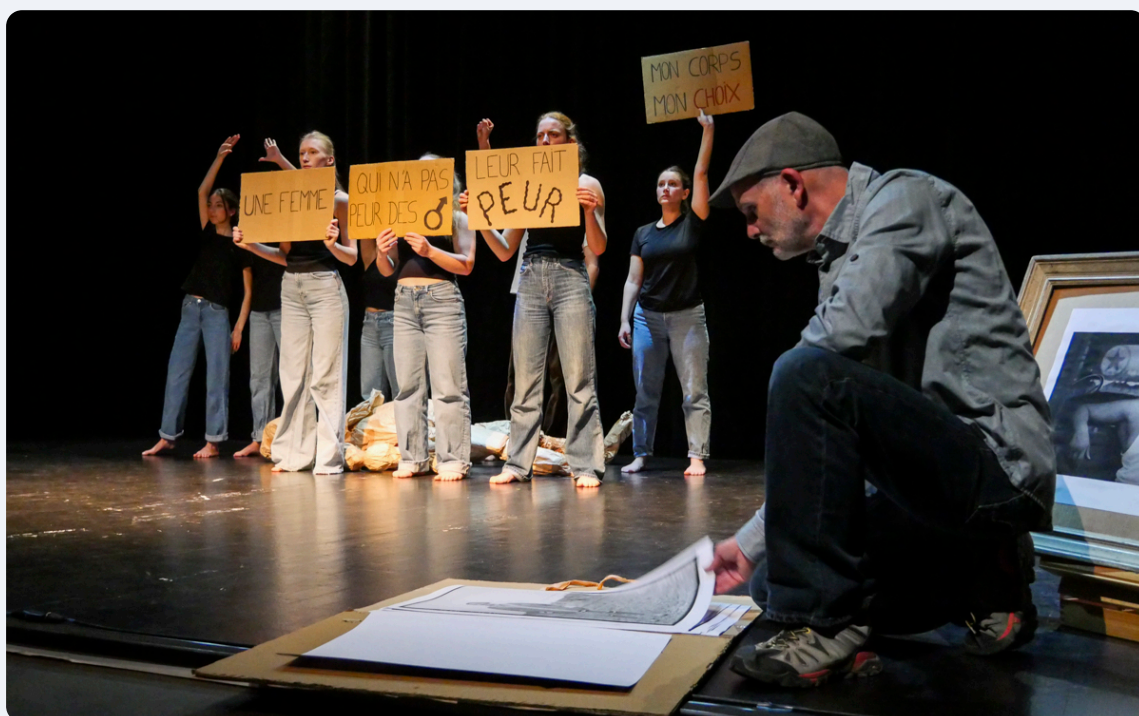
Restitution du projet HArtCorps